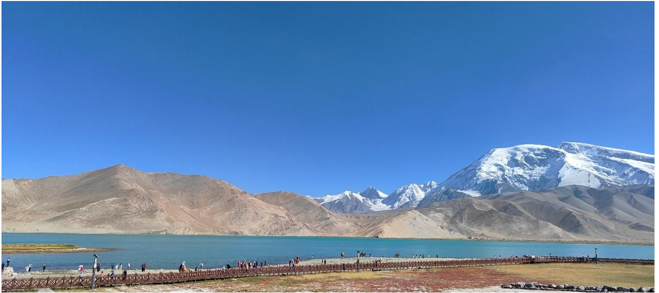
カラコルム・ハイウェイを進み、パミール高原地帯にある標高 3600mにあるカラクリ湖。標高 7600m超える山々の麓にあり、一帯は草原

以外は常時、一人であった。乗り継ぎの関係もあって、敢えて青島でそれぞれ一泊した。カシュガルには航空機で12日夜中に着き、空港からタクシーでホテルへ。支払いは基本的に電子決済、圧倒的にWeChatpayが多い。翌13日午前中に、空港近くのカシュガル入国管理局にタクシーで出向き、難なく「辺境管理区通行証」を無料で取得できた。受付機で通行証発行の受付番号表を発行、パスポートを提出するだけ、言葉を一切発することはなかった。配車アプリで車を呼び、香妃園景区(アバク・ホージャ墓、香妃墓)に向かう。自治区内で私が訪れた「旅游景区」は、65歳以上は国籍を問わず身分証明書を提出すれば無料であり、景区内の電動カートは無料だったり半額だったりした(因みに青島、ウルムチの地下鉄も無料だった)。老人(?)には優しい国だと思った。