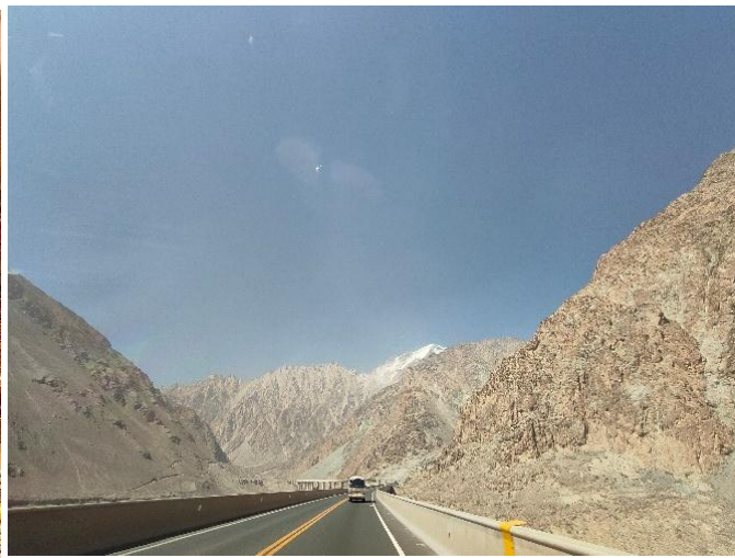
写真は全てカシュガル。左上はカシュガル老城（観光地）内にあるモスクであるエイティガール寺院（写真奥）で時間は午後9時過ぎ。右上は同じく老城内の銅器製造の職人。左下は老城内の午後9時過ぎの風景で、漢族の旅行者で賑わう。右下は、カラクリ湖に向かうカラコロム・ハイウェイ