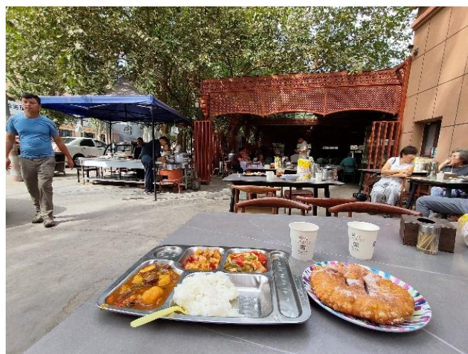
上左は清水河のアーケード商店街、昼過ぎだったのでは人通りは少ない。上右はグルジャの恵みの伊犁河、水量も多い。下左はグルジャの伊寧駅からウルムチ南駅向かう途中の「清河」駅を過ぎてから綿花の咲き誇る畑を目にする光景が増えた。下右はある日の昼食。トルファンの蘇公塔からホテルまで歩いて〔1時間弱〕帰る途中あったbuffetも提供するレストラン。戸惑っていたら、香港から来たと思われる旅行者が英語で、値段と美味しいこと教えてくれた。

だけの電力を必要するほど発展しているわけでもある。そして砂漠を激変させる壮大な計画と絶対的実行力は、今の人力、機械力によるものと驚きを隠せない。