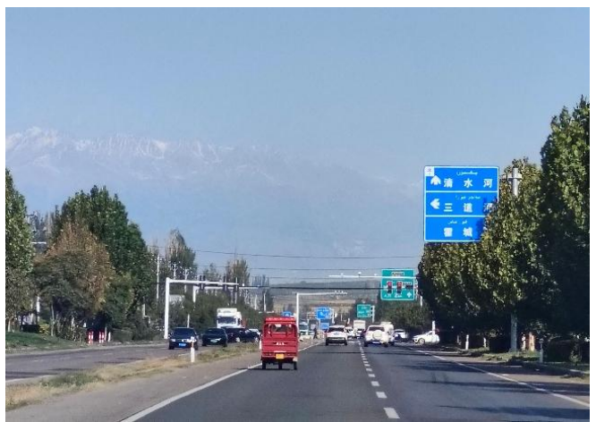
上：自治区内のボルタラ・モンゴル自治州にあるサイラム・ノール 中左は山の中腹からみる山間を結ぶ果子溝高架橋。中右はカザフスタン国境のコルガス口岸、一帯は鉄条網が張り巡らされている。 下左はグルジャからコルガスの間にある清水河に行く途中にあった整然とした新しく造成中の街並み。下右は同じく途中の道路で、美しい風景で、ともに監視カメラが。