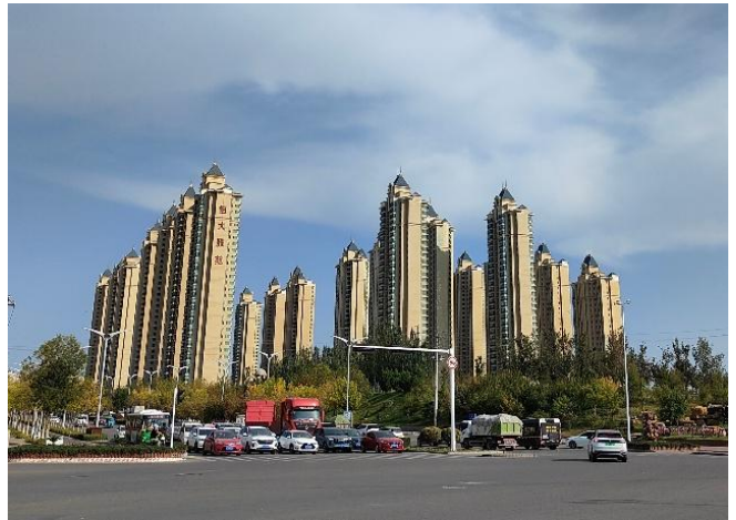
左上は、グルジャの少数民族居住区の喀贊其民族旅游区「伊犁老城文化旅游区」の入り口あるイスラム教のモスクである陝西大寺。右は、同じく近隣の解放南路にある伊寧市解放南路清真寺。左下はグルジャの伊犁河大橋に近くで見かけた仏教寺院「華寧寺」。右下は、伊犁河大橋のバス停にある例の「恒大集団」が建てたアパート群の「恒大雅苑」

いは電子決済、復路も同料金だった。往復とも当然、検問所があったが、前日と違って検問を受けている車を横にみつつ通過して戻った。ローカルバスも楽しいものである。今回はここグルジャでは公安がホテルに来て、目的、日程などを聞かれたが、今回は、どこでも一切そのようなことはなかった。国境近くのパミール高原とコルガスの検問所は、外国人故に厳格だっただけのことである。