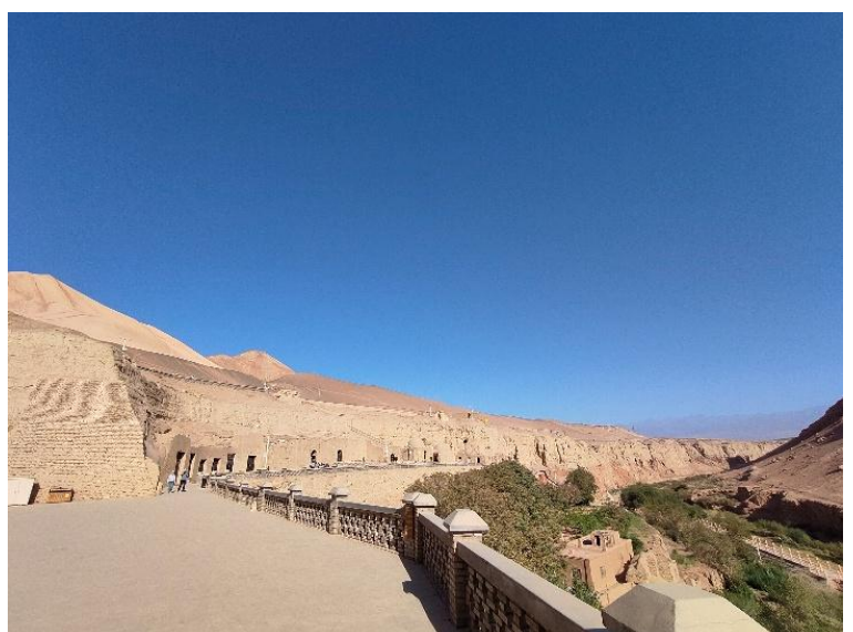
写真はともに、「トルファンの仏教文化の最高峰」とされるベゼクリク千仏洞