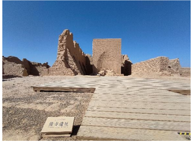
左は、トルファン トルファン の城跡遺跡の高昌故城近くの田舎の道路、奥に西遊記にも登場する火焰山が見える。右は高昌故城の仏教寺院跡の「仏寺遺址」

段かと思ひ直した。ここでは、砂漠という厳しい自然の中で断崖絶壁に洞窟を掘り、そこに仏像を描くという仏教の信仰の壮大な計画と実行力に圧倒された（交河故城の仏教遺跡も同様）。また異文化の進入が元の文化を破壊する「情念」は、当事者にとっては「当然」だったとしても、時を経ることによって、まことに残念な行為であることを目の当たりにした。この思いも海外神社の位置づけと関わりがありそうだと痛感したのである。千仏洞では英語の団体ツアーがあり、高昌故城ではブラジルからきたというヨーロッパ系の夫妻にも出会った。17日と19日は、バスで、交河故城、天山山脈の雪解け水の地下水路施設トルファン・カレズ楽園（吐魯番坎兒井楽園）、葡萄溝、隣接した蘇公塔と吐魯番郡王府もバスと徒歩で出向いた。いずれも入場料は、老人無料。